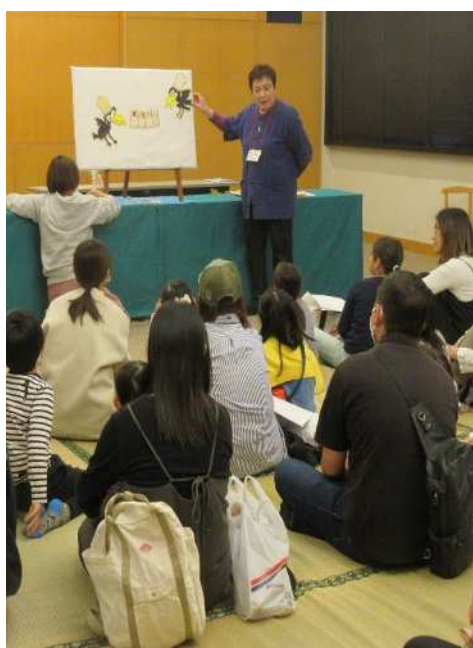
おはなしフェスタ