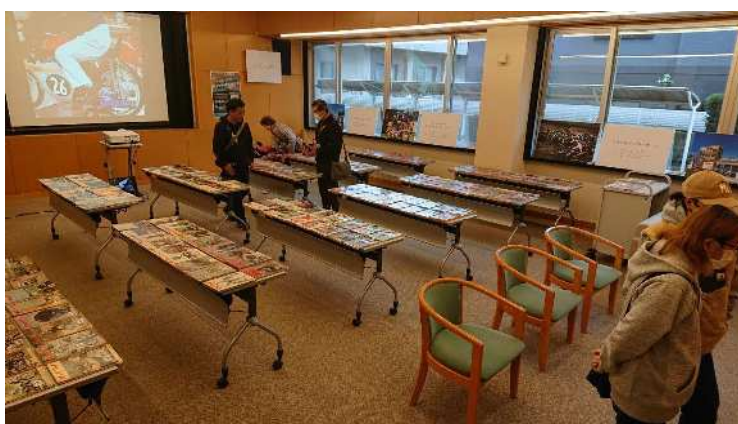
バイク雑誌大展示会