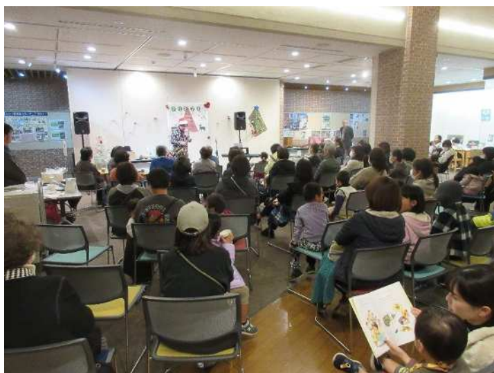
ロビーコンサート