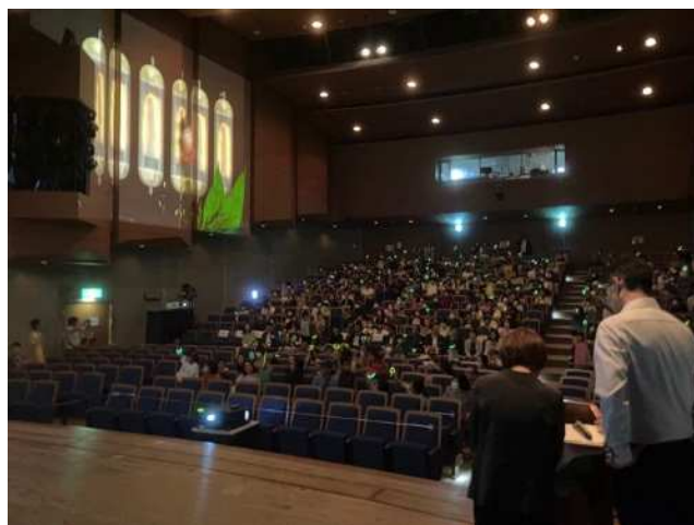
福岡ハカセの読書会